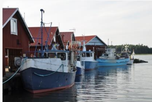
Spikens fiskeläge.

Vänerns vattenvårdsförbund ansvarar sedan 2013 för samförvaltningen av fiskefrågor. Det är en samverkansform mellan fiskets intressenter där viktiga frågor kan diskuteras och förslag på förändringar kan beredas. Här kommer information om samförvaltningen och dess verksamhet att finnas.